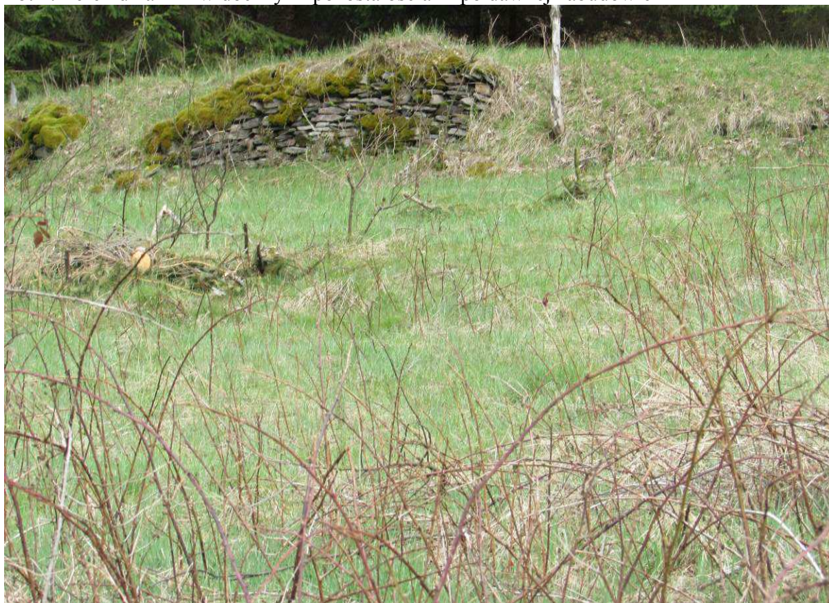
Fot 1. Teren działki z widocznymi pozostałościami po dawnej zabudowie

Omawiany teren nie posiada obowiązującego miejscowego planu zagospodarowania przestrzennego.