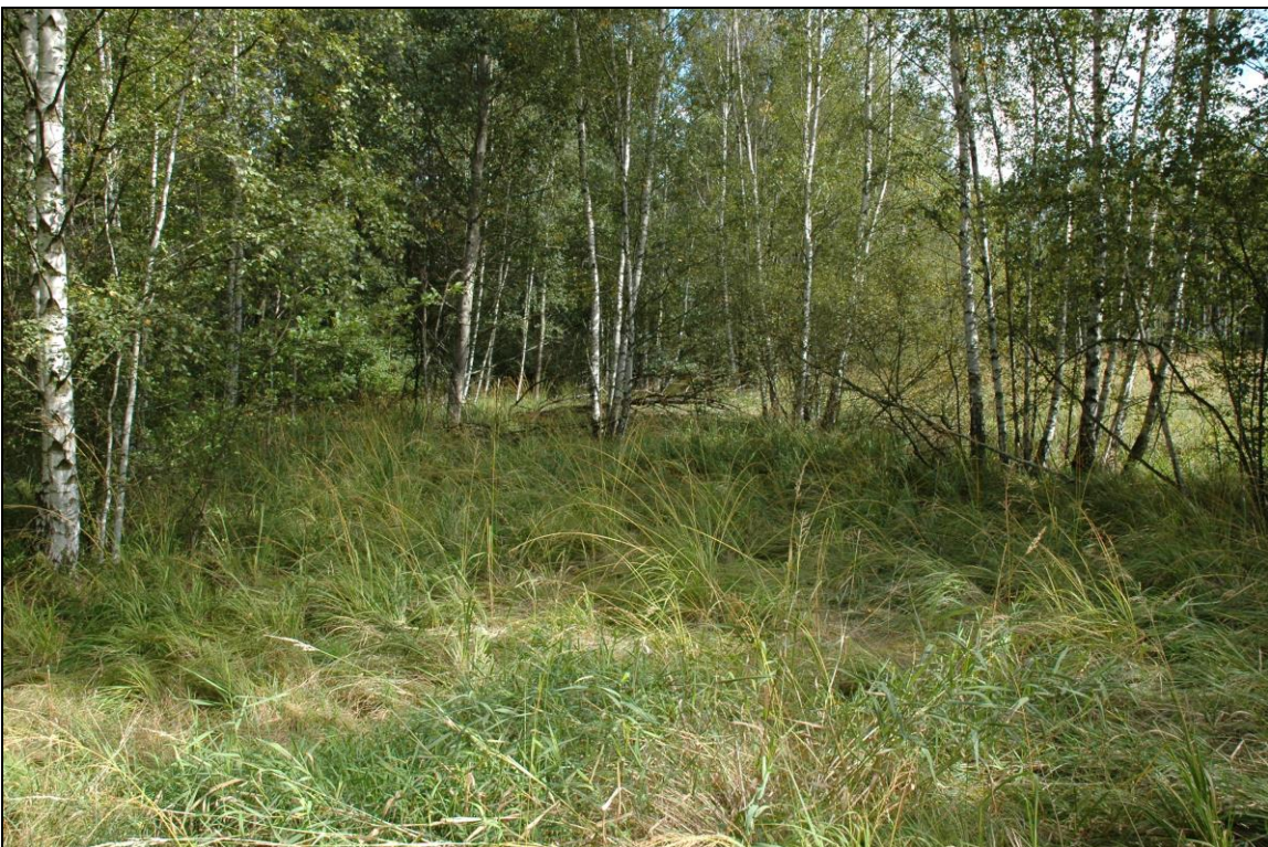
Zdj. nr 3.4