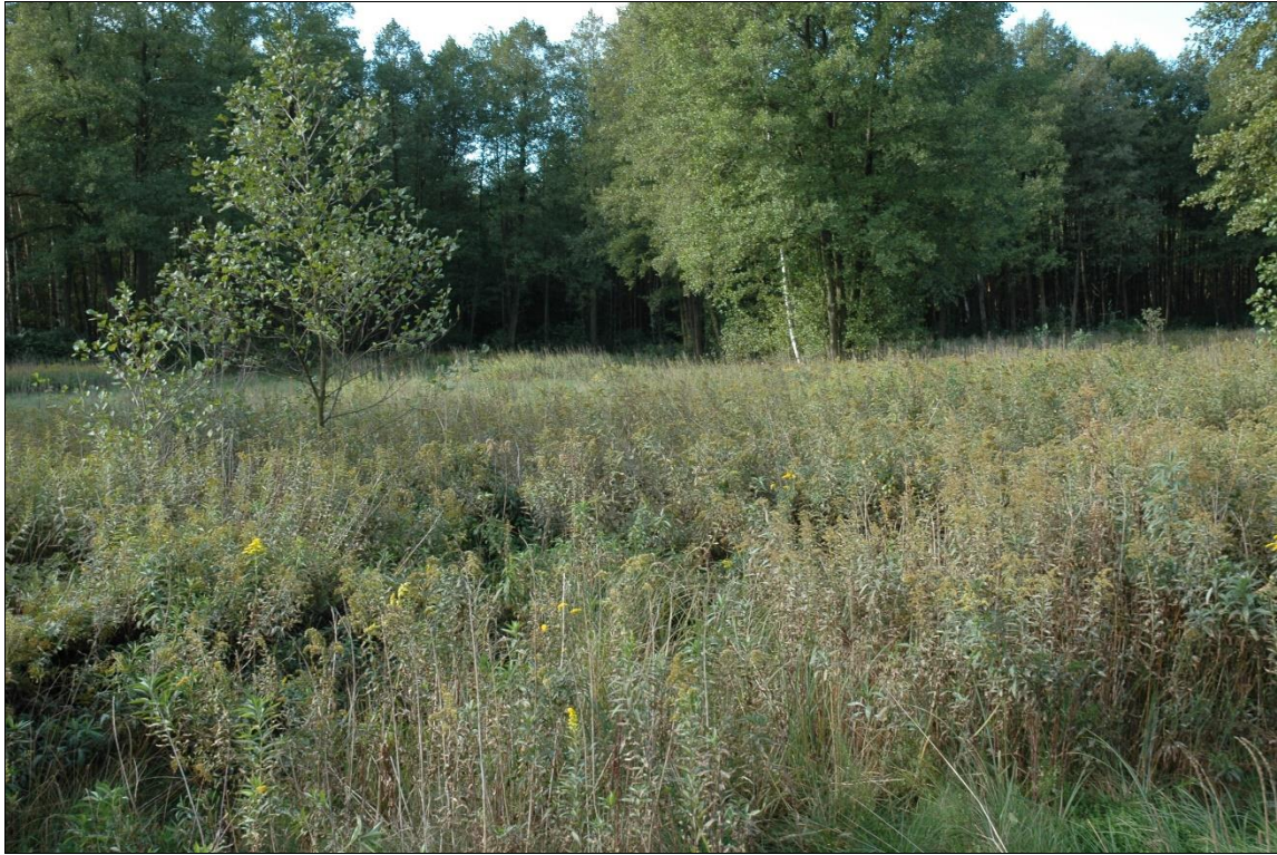
Zdj. nr 1.6.