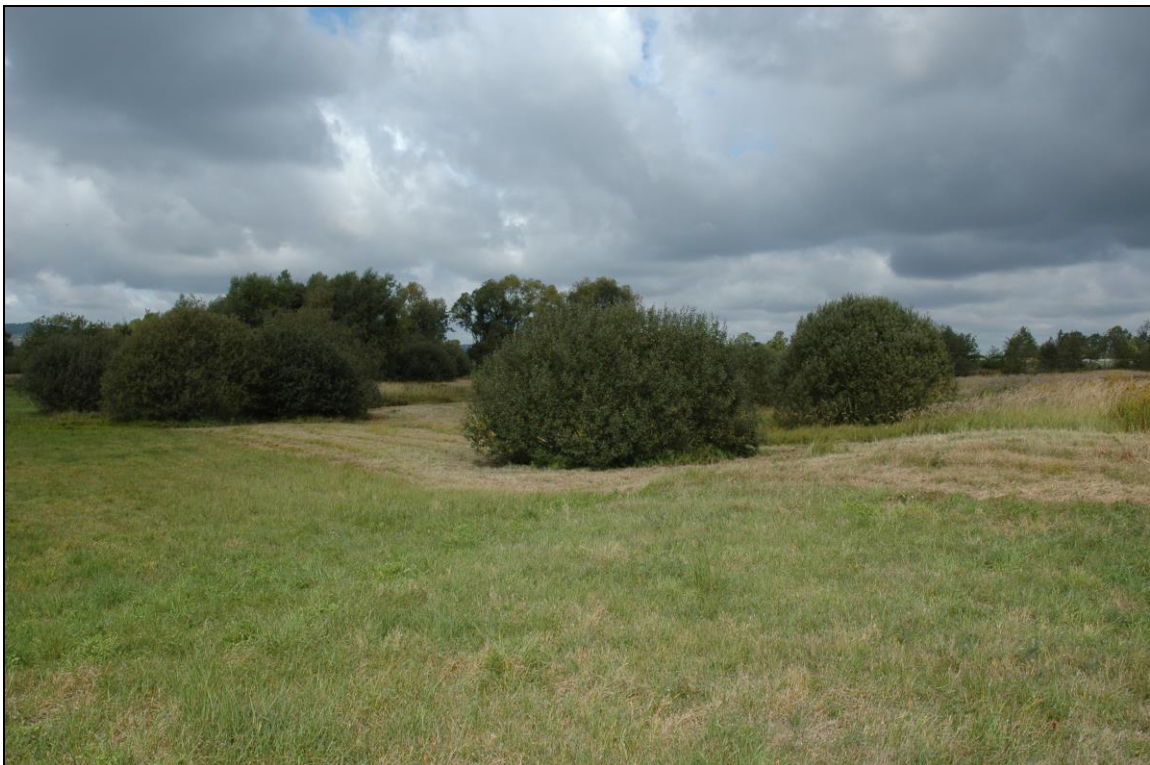
Zdj. nr 3.6.