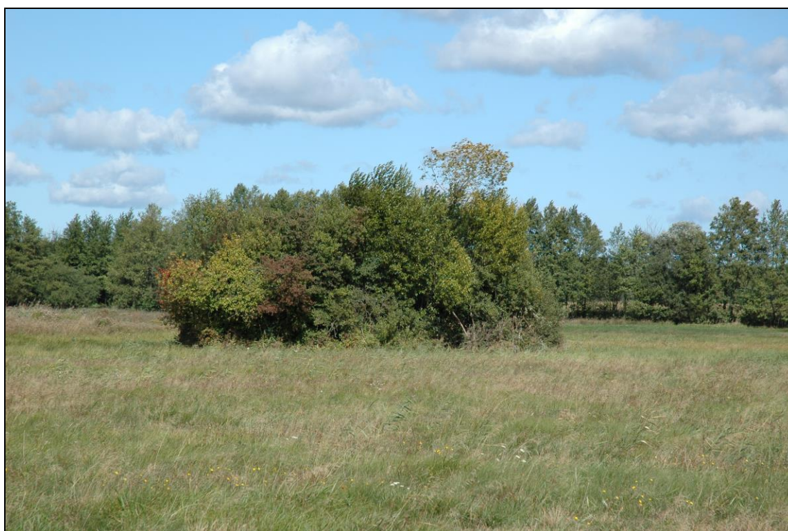
Zdj. nr 1.1.