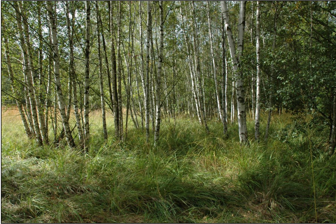
Zdj. nr 3.1.