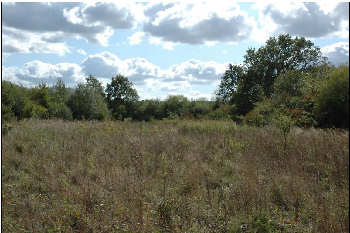
Zdj. nr 1.5.