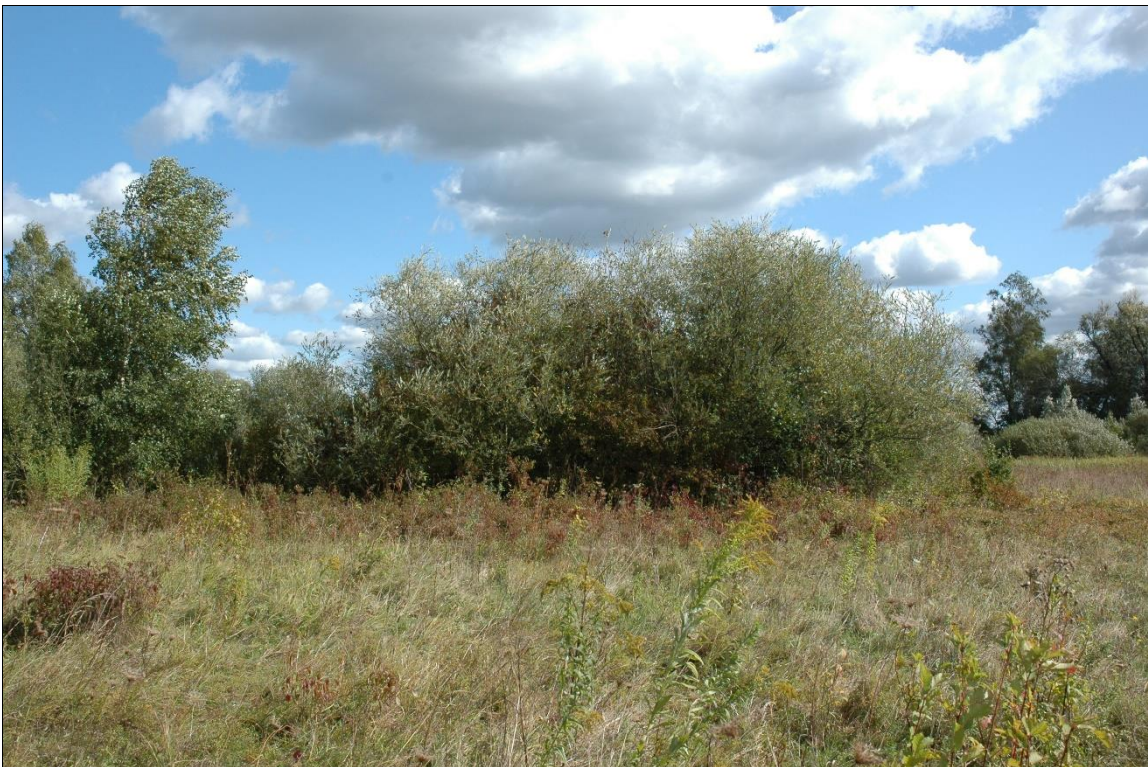
Zdj. nr 1.3.