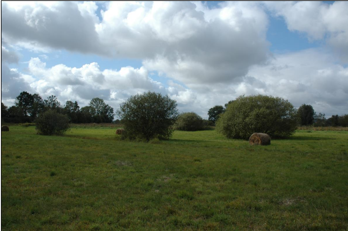
Zdj. nr 3.5.