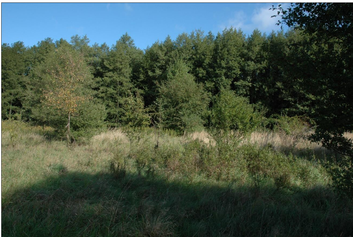
Zdj. nr 1.10.