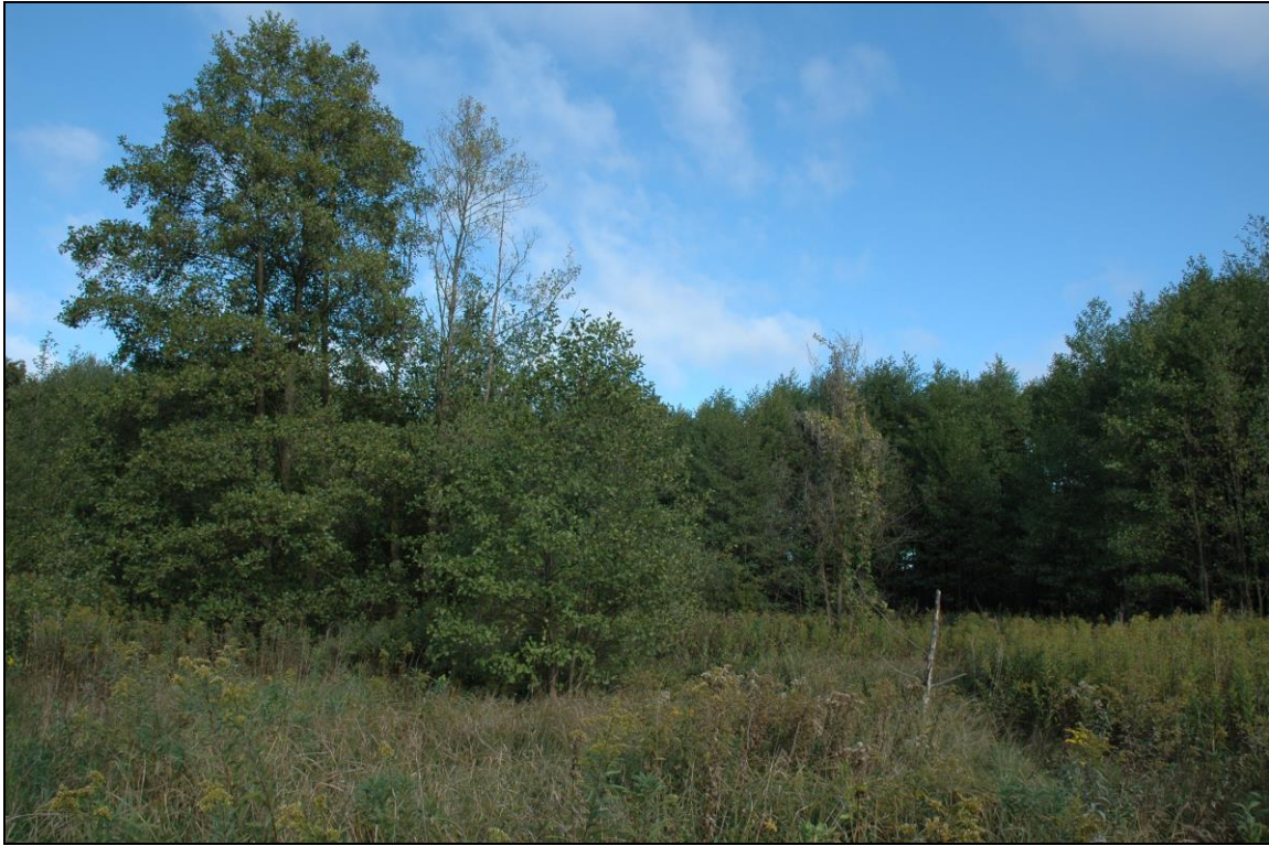
Zdj. nr 1.12.