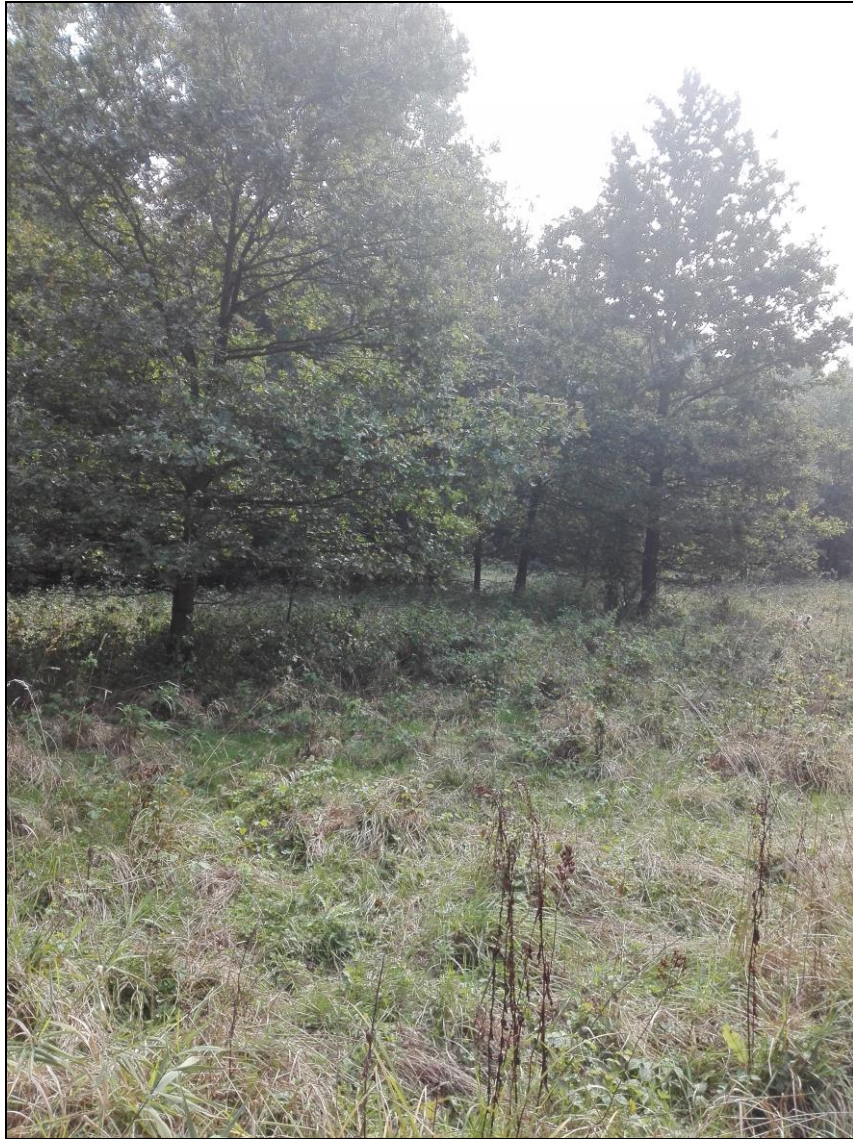
Zdj. nr 2.2.