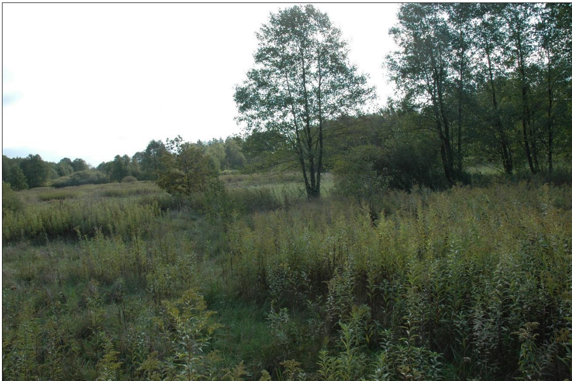
Zdj. nr 1.7.