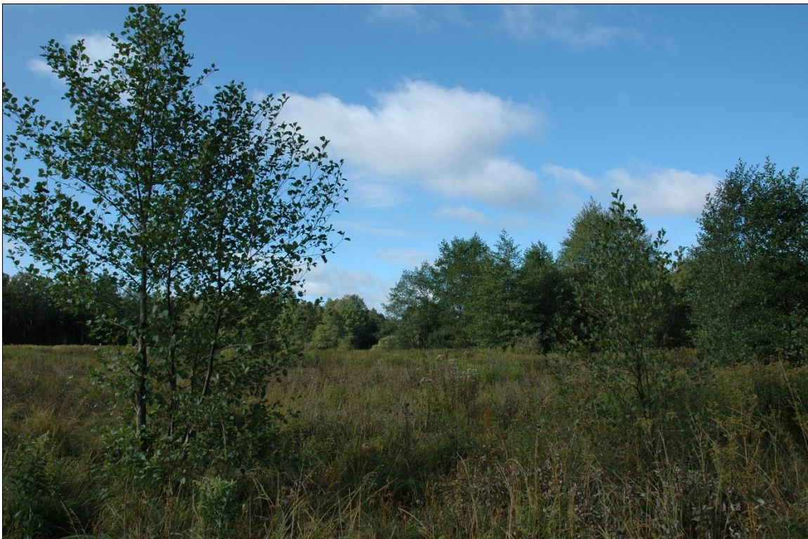
Zdj. nr 1.9.