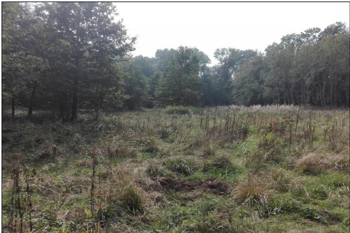
Zdj. nr 2.1.