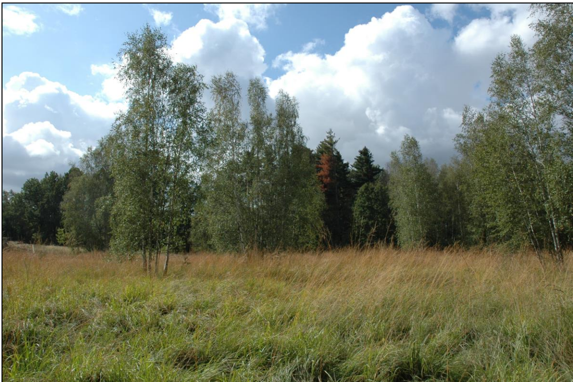
Zdj. nr 3.2.