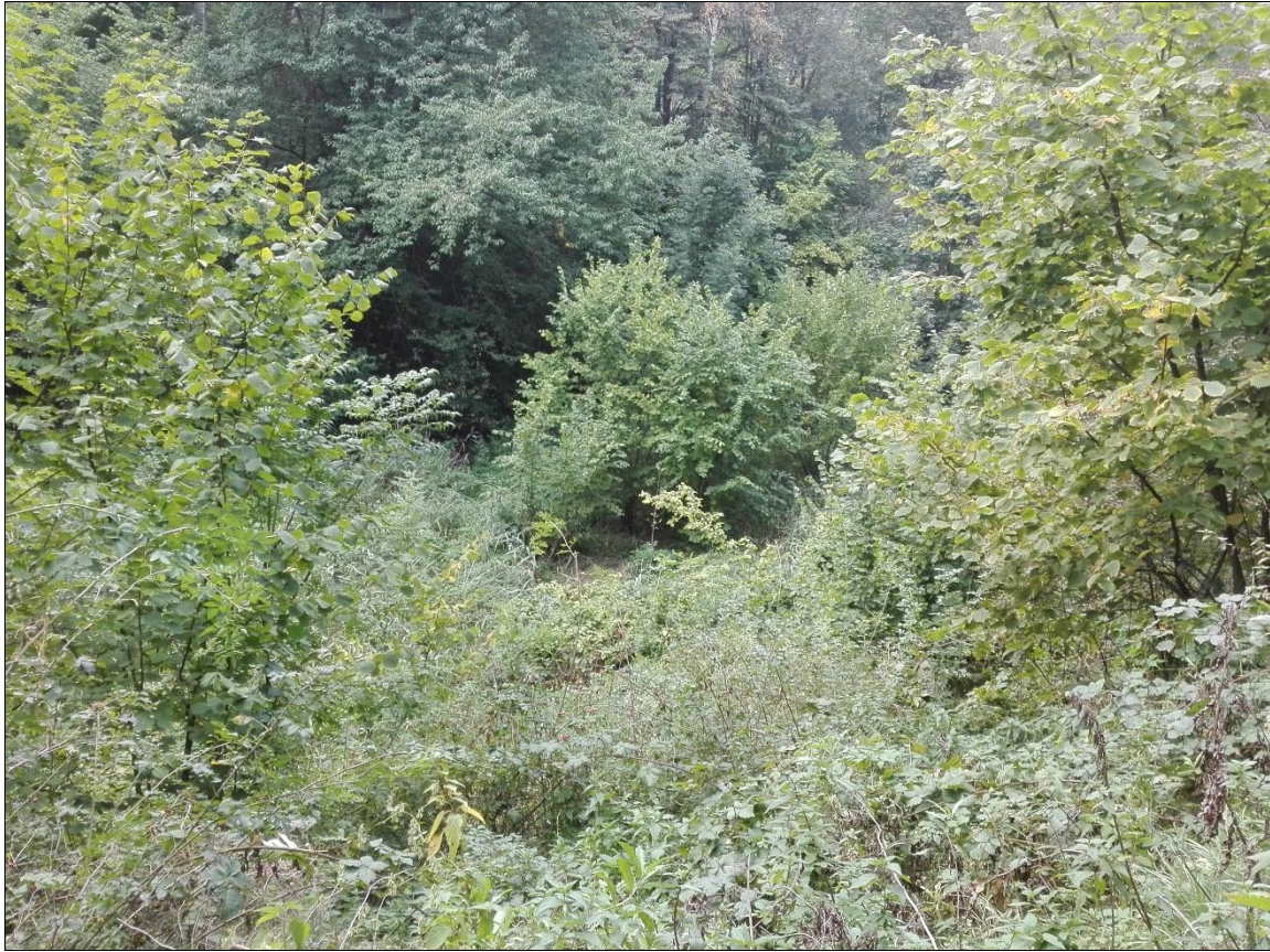
Zdj. nr 4.2.