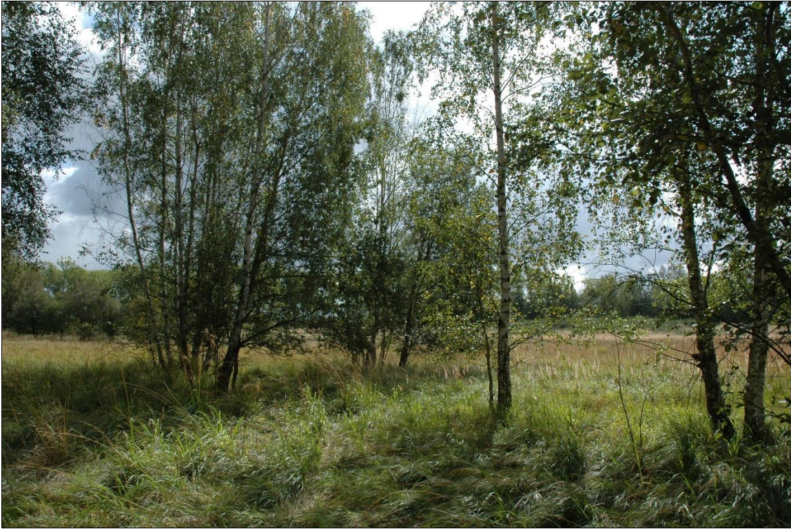
Zdj. nr 3.3.