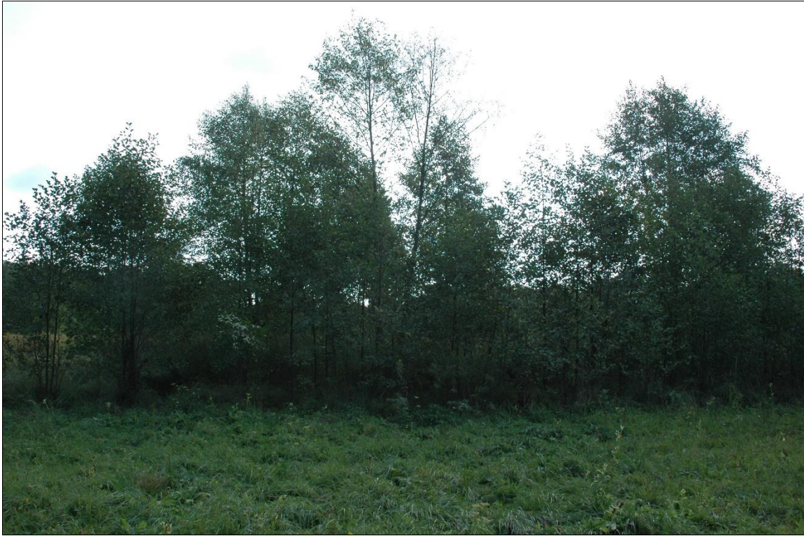
Zdj. nr 1.8.