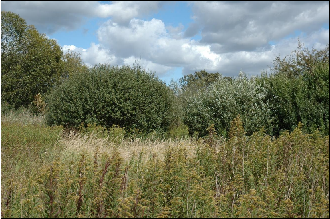
Zdj. nr 1.4.