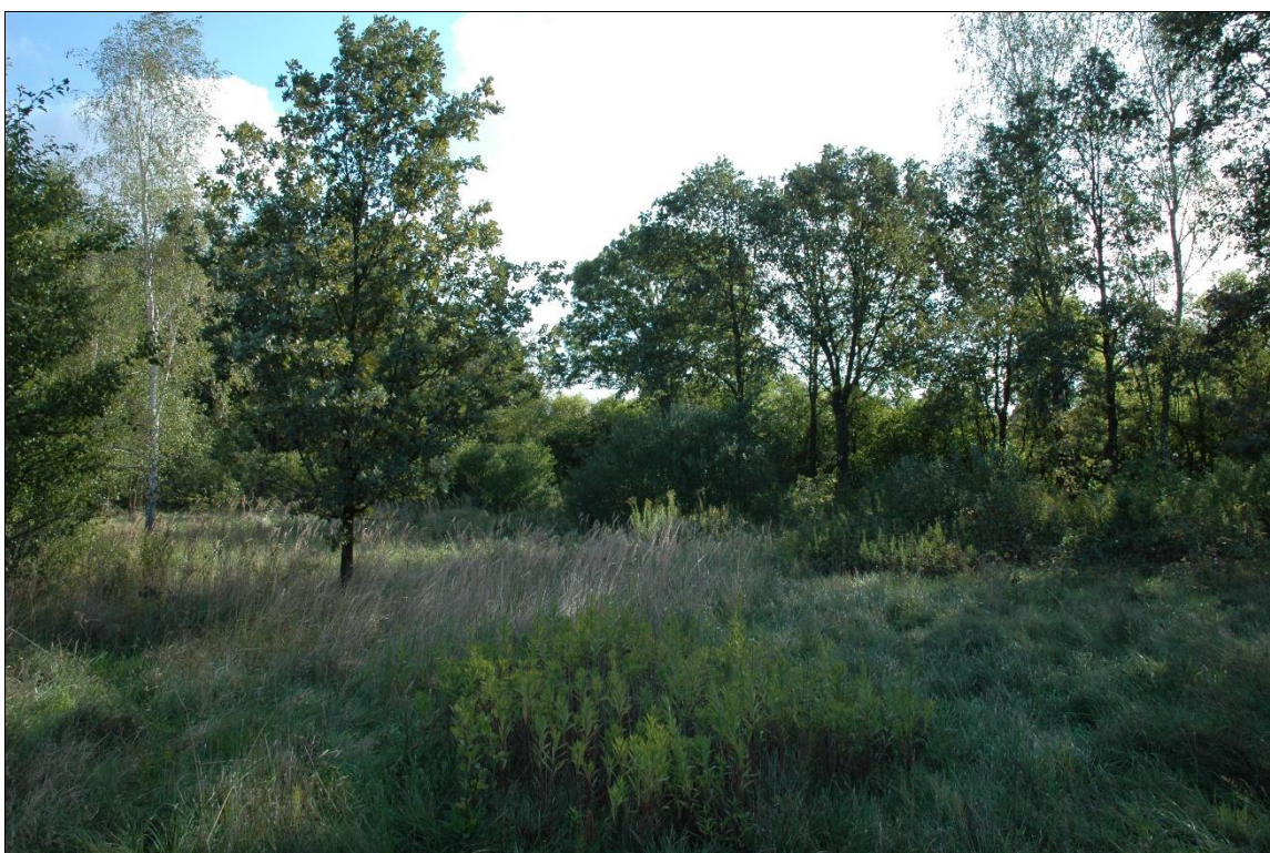
Zdj. nr 1.11.