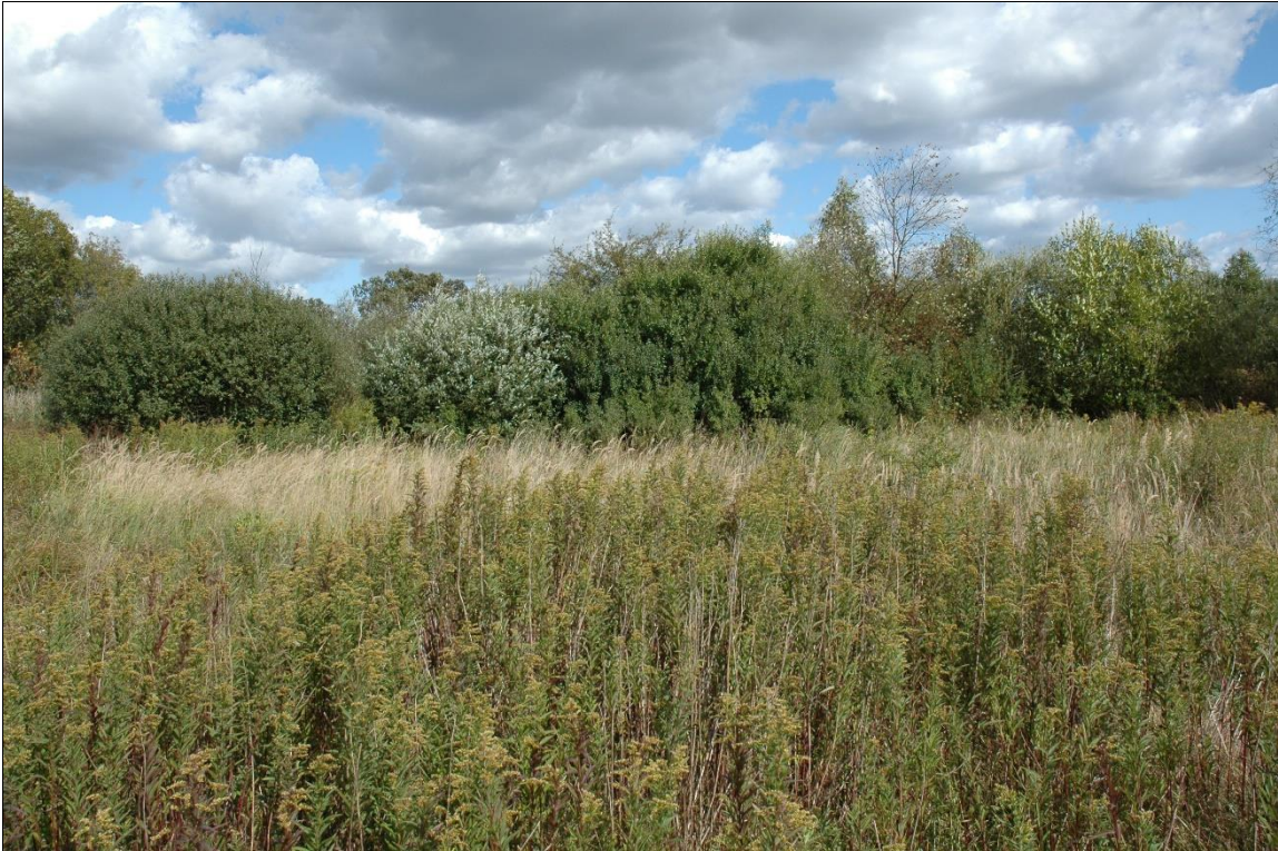
Zdj. nr 1.2.