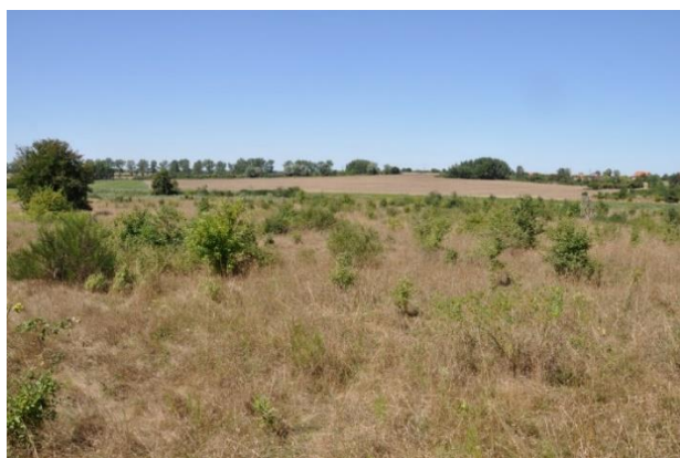
Zdj. 1, 2. Przykłady działek rzadko porośniętych .