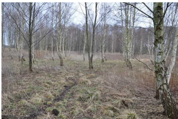
Zdj. 3,4. Przykłady działek średnio porośniętych .